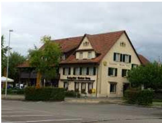
Landgasthof Weisses Kreuz, Gippingen